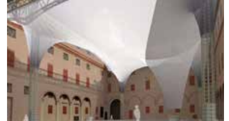
La copertura rimovibile nel chiostrino del castello di Ferrara