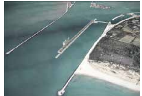
"Venis Cruise" 2.0: la proposta per tenere le navi da crociera fuori dalla Laguna di Venezia