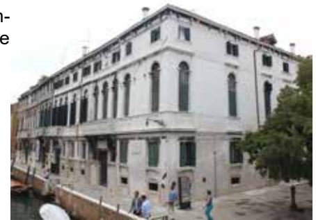
Palazzo Zen a Venezia: il restauro delle facciate.