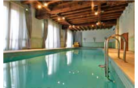
Restauro di Villa Fürstenberg - La piscina