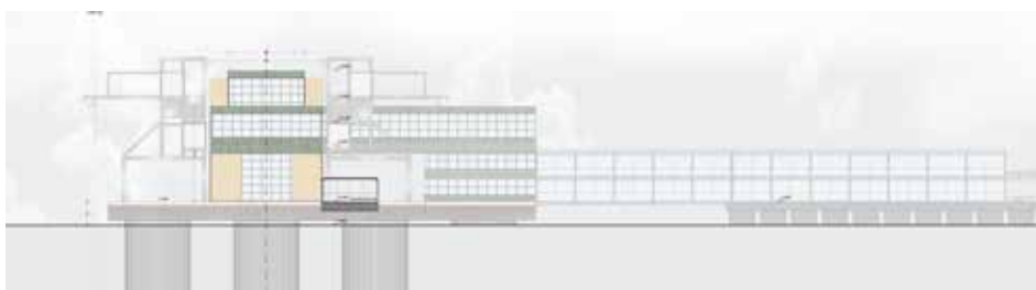
Prospetto Est del nuovo porto croceristico "Venis Cruise 2.0" (progetto).