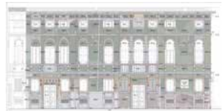
Analisi del degrado di Palazzo Zen a Venezia