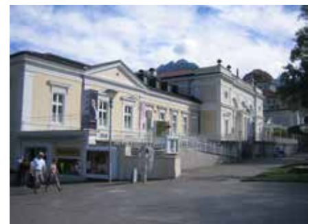
Restauro delle facciate del Kurhaus a Merano (BZ).