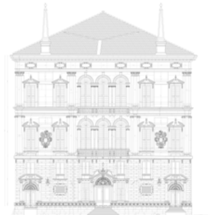
Rilievo di Ca' Balbi sul Canal Grande a Venezia