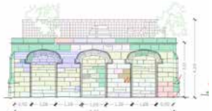
Analisi del degrado di un edificio pertinenziale a Stoneleigh Abbey - UK