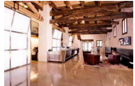
Restauro di Villa Fürstenberg - Ingresso alla banca